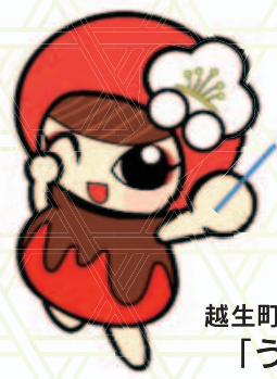
越生町のマスコット「うめりん」