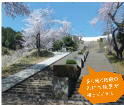
長く続く階段の先には絶景が待っているよ