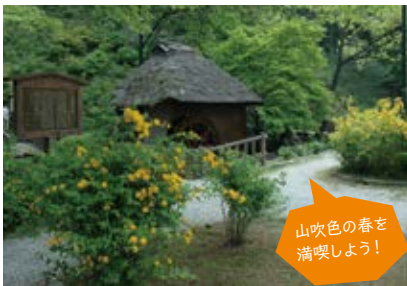
山吹色の春を満喫しよう！

昭和30年頃まで“じゅんさい”が自生していた大谷ヶ原万葉公園（大亀沼）は、万葉集にうたわれた古代ロマンの地。 園 越生町大谷1511