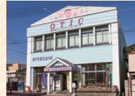
観光案内所オーティック