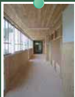
廊下も木の香りがいっぱい