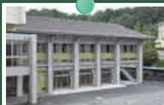
武道場・技術科室