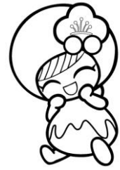
越生町のマスコット「うめりん」

本町では、子ども・子育て支援に関する施策を総合的かつ計画的に推進するために本計画を策定します。