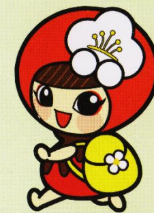
埼玉県けんこう大使

各地区の詳細な地図は町のホームページにも掲載しています。 http://www.town.ogose.saitama.jp/