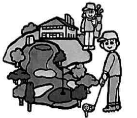
武蔵の杜カントリークラブ

正福寺の街道左側、新名所「つつじ山公園」が4月下旬~5月上旬には咲きほこりキレイです。