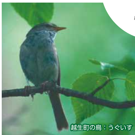
越生町の鳥：うぐいす