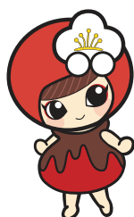
越生町のマスコット 「うめりん」