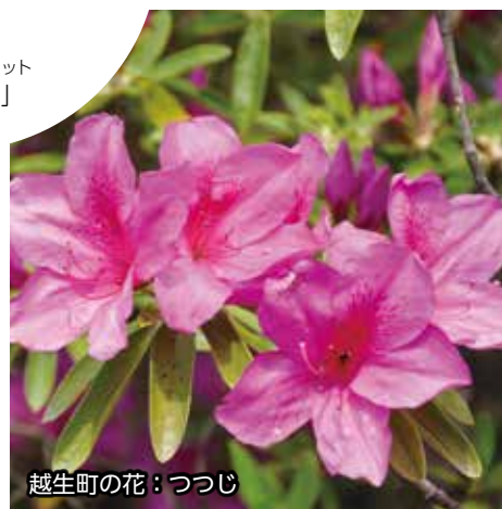
越生町の花：つつじ