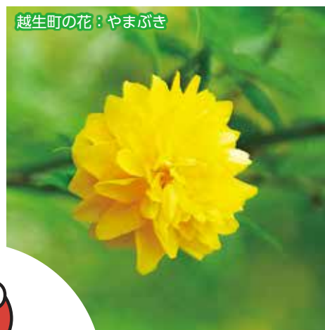
越生町の花：やまぶき