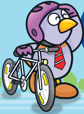
埼玉県マスコット 「コバトン」