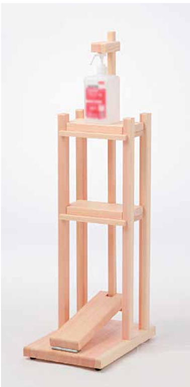
▲黒澤木工所(古池)の作品