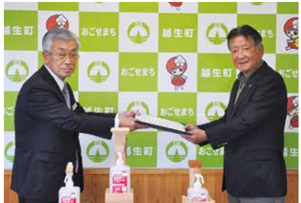
▲アルコール消毒液スタンドを寄贈する長島商工会会長と新井町長

現在、役場庁舎に3台が設置されており、今後、公民館などの施設にも追加で設置される予定です。