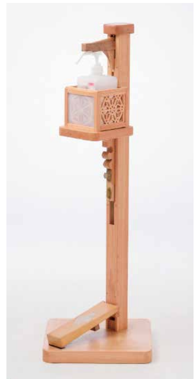
▲浅野木工所(黒岩)の作品