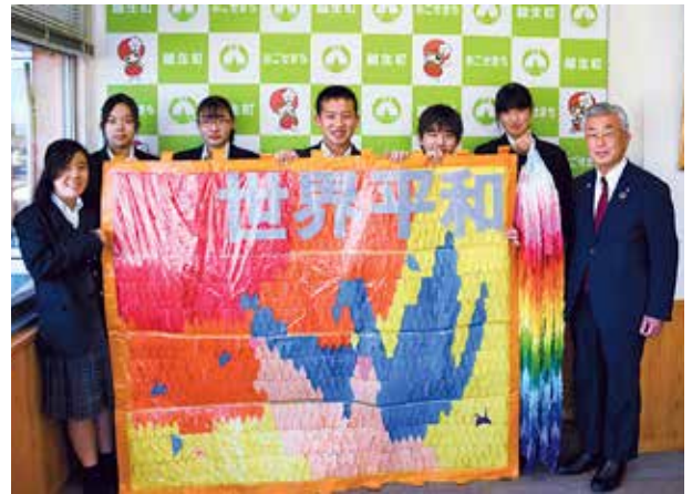
▲千羽鶴を寄贈した時の様子

12月22日(水)、県立越生高校の生徒のみなさんが平和の祈りを込めて折った千羽鶴が世界無名戦士之墓に寄贈されました。この千羽鶴は、毎年、修学旅行で広島県の平和記念公園（原爆ドーム）を訪れる際に、生徒が作成し奉納しているものですが、新型コロナウイルス感染拡大の影響でこの2年修学旅行が中止となったため、同じ恒久平和を願う世界無名戦士之墓へ平和の祈りとともに寄贈されました。