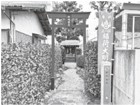
左：耕地稲荷(越生町越生東2-7-3) 右：児玉稲荷(越生町上野東3-13-5)

の帰途、頼朝の馬の前に美少年が現れ、歩いて法恩寺まで従いました。頼朝がこの童に「おまえは何者だ」と尋ねると、童は「私は堂山村の稲荷です。將軍様を守護して供奉し送って参りました」と言い、たちまち白狐に変化して田中の森に入っていきました。頼朝は不思議に思い、森の中に「歩行の稲荷」すなわち「祠歩稲荷大明神」を祀りました(『法恩寺年譜』)。この稲荷社が、どこの稲荷社なのかは不明です。「耕地稲荷(越生東)や「児玉稲荷」(上野東)が比定されています。