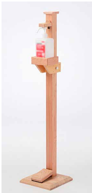
▲株式会社金子木工所(成瀬)の作品