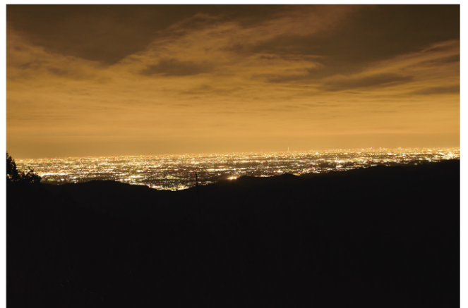
野巣張り見晴らし台から (龍ヶ谷)