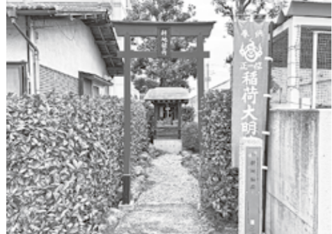
左: 耕地稲荷(越生町越生東2-7-3) 右: 児玉稲荷(越生町上野東3-13-5)

です。翌建久元年11月の頼朝上洛の際には、「小越四郎(有平)」が先陣・畠山重忠の随兵の四番を、「小越右馬允(有弘)」は後陣随兵五番を務めています(鎌倉幕府編さんの「吾妻鏡」)。 越生の頼朝伝説 ①法恩寺(大字越生) 天平10年(738)に、東国遊行中の行基が開創したと伝えられています。その後荒廃するも、鎌倉時代に越生氏一族の倉田基行夫妻が、現れた天竺僧とともに、紫雲棚引く古井戸の中から行基が奉じた五尊の仏像を見つけました。夫妻は草堂に仏像を祀り、出家して瑞光坊、妙泉尼と名乗りました。建久元年、この