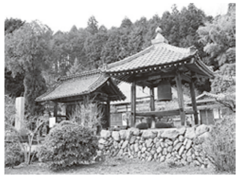
最勝寺(越生町堂山287)

地を訪れた頼朝は二人の話に感銘を受け、土地と田畑を寄進し、基行の甥の越生次郎家行に堂塔伽藍を建立させました(「法恩寺年譜」)。 ②祠歩稲荷(所在地不明) 堂山村(現大字堂山)からの帰途、頼朝の馬の前に美少