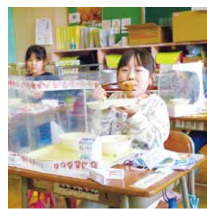
小学校の給食の様子

不登校ゼロ、いじめ解消100%を目指して取り組んでいます。 (1) さわやか相談室・適応指導教室の充実 適応指導教室（図書館2階）やオンライン学習を有効に活用し、指導体制を充実させていきます。 (2) 体験活動の充実 豊かな心を育成するため、越生町の特色を生かした、体験活動の充実を図っていきます。