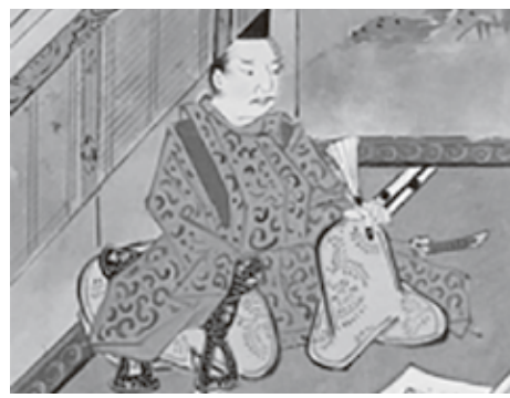
北条義時

北条氏の執念 源頼朝の死後、北条時政（演・坂東彌十郎）や子の義時（演・小栗旬）ら北条氏は、2代將軍の頼家に重用されていた比企氏一族を滅亡させたほか、数々の有力御家人たちを排除して要職を独占していきまされた。時政の策略によって頼家も暗殺され、北条氏は次將軍に頼家の弟でまだ