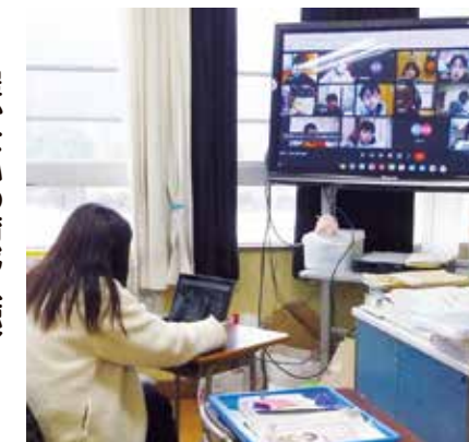
家庭と繋いだオンライン授業

越生町では、平成25年から35人以下学級に取り組んでいます。令和3年度から令和7年度にかけて国は小学校の35人以下学級を段階的に行っています。越生町は、小・中学校全年で35人以下で取り組み、きめ細やかな指導を行っています。