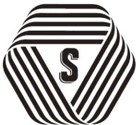
厚生労働大臣認可

厚生労働大臣認可の標準営業約款制度に従って営業しているお店は、店頭に「Sマーク」を掲げています。このマークを掲げたお店は、安心・安全・清潔が保障され、万一の場合、事故賠償基準に基づいた補償も受けられます。みなさんの信頼できるお店選びの目安にしましょう。