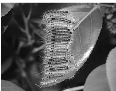
ツバキの葉とチャドクガの幼虫