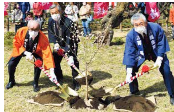
▲左から島田梅産地を元気にする会会長、島野観光協会会長、新井町長

「魁雪」は、毎年白い花を咲かせ、訪れた人々を楽しませてくれます。樹木なので枯れてしまう可能性があるため、魁雪の枝を接ぎ木した苗木を育ててきました。今後も永く、その遺伝子を残していくために越生梅林内に、その苗木を植樹したものです。