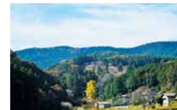
9 虚空蔵尊さくら山