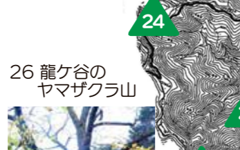
26 龍ヶ谷のヤマザクラ山