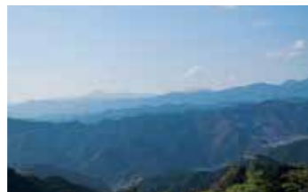
19 顔振峠 飯能・秩父方面を望む