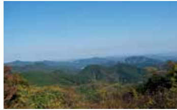
25 野末張見晴台 日光方面を望む