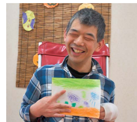
▲完成した作品、題名は「ぶどう狩りて雨が降ってきた」