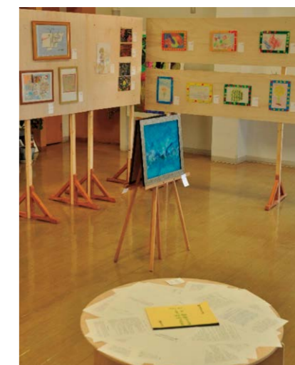
▲第2回障がい者アート展の様子

日時 12月8日（金）～12月12日（火） 午前9時～午後4時（12日（火）は正午まで） 会場 里の駅・おごせ【観光センター】 越生町越生741-2