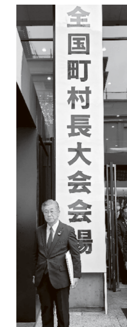
▲全国町村長大会に出席

今回は「少子化対策を推進し、こども・子育て政策を強化すること」など17の決議・「全国的な防災・減災対策、国土強靱化の推進に関する緊急決議」・3項目の特別決議をし、35の要望を決定しました。