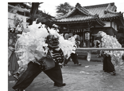
▲東山神社の獅子舞(2019年撮影)

また、東山神社の獅子舞も五庭あります。この獅子舞の由来は、室町時代に多門寺の住職が、秩父地方から習得したと伝えられ大変古い歴史があります。今年は11月25日と26日に行われて越生の獅子の舞い納めになりました。