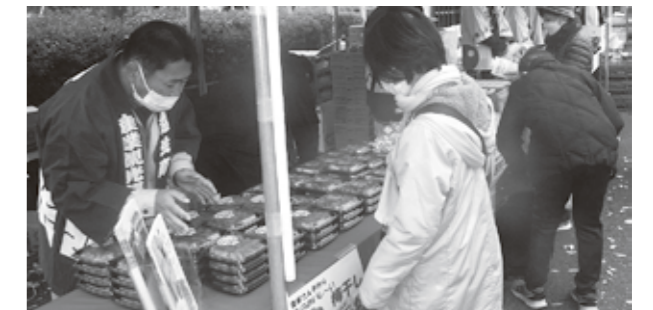
▼農業祭出展の様子