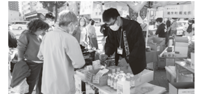
▲アサカストリートテラス出展の様子

11月20日(日)、朝霞市農業祭にも参加し、また、梅干し、ゆずジャム、梅加工品等を販売したほか、越生町の宣伝を行いました。