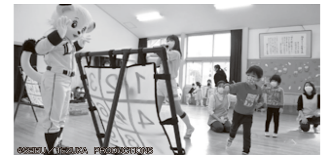
▲投げ方を教えてもらい、的にあてる園児たち

11月21日(月)、越生みどり幼稚園に埼玉西武ライオンズの球団マスコット「ライナ」が来園しました。園児たちは、ライナと一緒にダンスをしたり、ボールを的にあてるストラックアウトゲームをしたりして楽しみました。