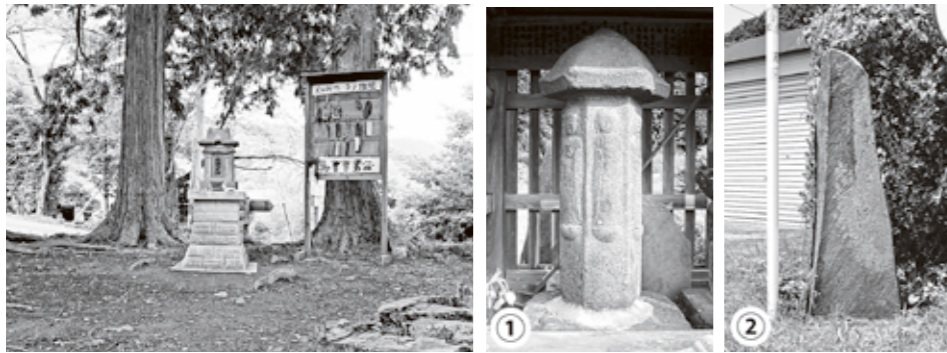
左:「越生子ノ権現」 ①六地藏(享保5年<1720>) ②古帳庵句碑(天保12年<1841>)