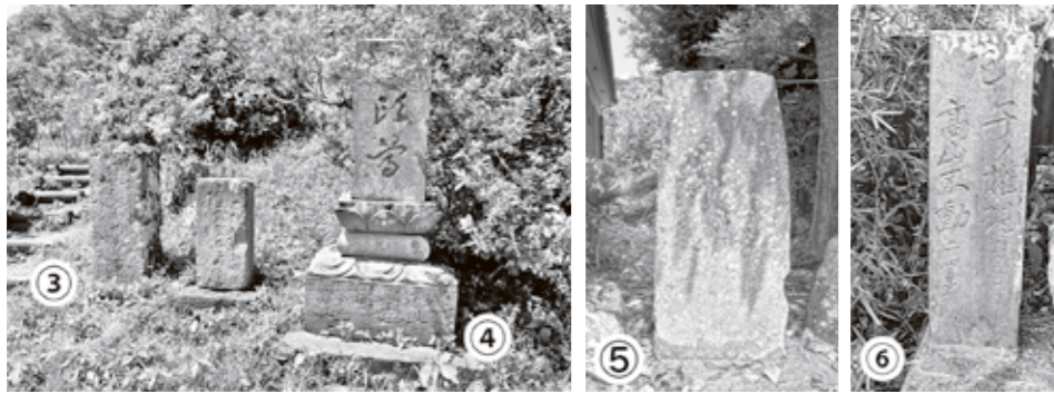
③廻国塔(年不詳) ④馬頭尊(文政13年<1830>) ⑤古帳庵句碑(天保12年) ⑥道標(元治2年<1865>)