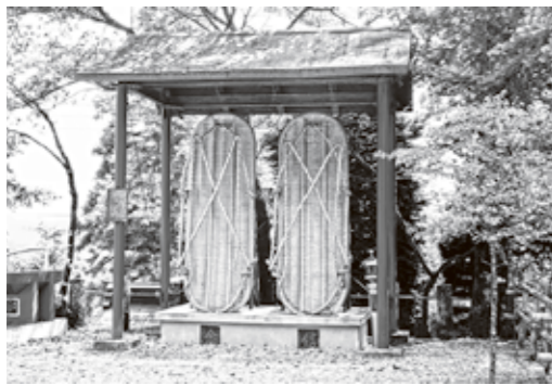
子ノ権現天龍寺の「鉄のわらじ」: 願掛けに履物を奉納する習わしがある

字路) ⑧道祖神(黒山・林道笹郷線入口) ⑨道標(堂山・最勝寺境内)。 「越生10名山指定記念ハイキング大会」に向け、「越生子ノ権現」(越生神社境内)で健脚祈願はいかがですか。