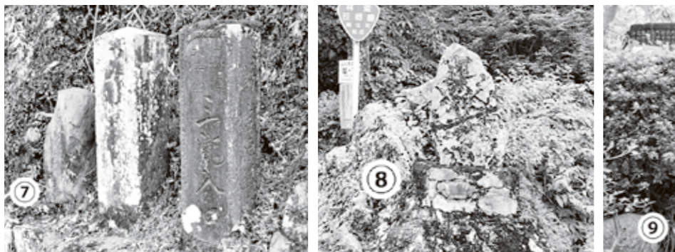
⑦道標(年不詳) ⑧道祖神(年不詳) ⑨金剛界大日如来と六地藏(年不詳)