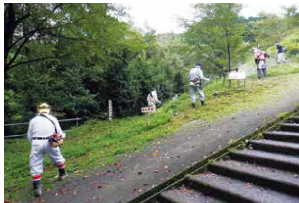
▲草刈り作業の様子

この活動は、コミュニティ活動の一環として町民のみなさんのご協力で行われています。