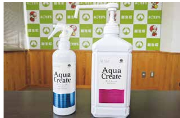
▲寄贈いただいたスプレー

こちらの寄贈品は、町の防災対策に有効に活用させていただきます。ありがとうございました。