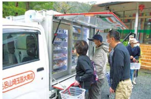
▲第1週および第3週の月曜日に指定場所を巡回します

町や越生町社会福祉協議会では、住民の皆さまとともに、今後も住み慣れた地域で暮らしていける取り組みを進めていきます。