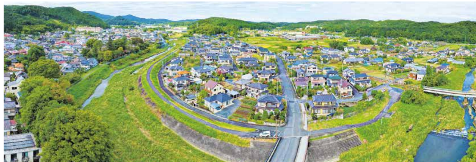
▲春日地区パノラマ