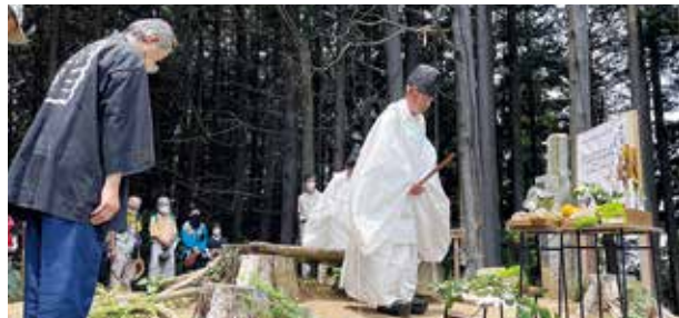
▲大高取山山頂での修祓の様子

観光協会では、越生10名山が指定されたことを記念して、11月20日に越生10名山指定記念ハイキング大会を開催するための準備が進められています。