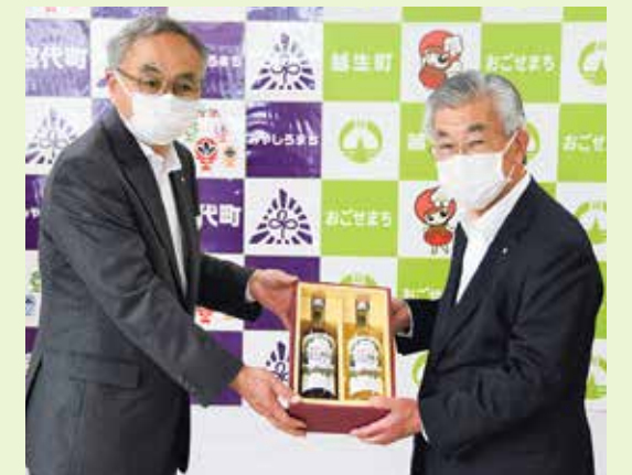
▲宮代町特産品の巨峰ワイン等をいただきました

町域を画すように北から東そして南へと、かつて利根川の本流であった古利根川が流れています。