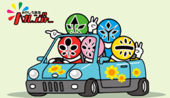
▲宮代町応援ヒーロー みやしろ戦隊ハナレンジャー