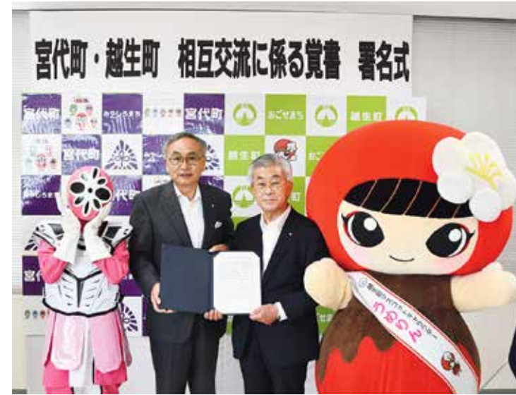
▲6月21日(火)覚書を手にする新井康之宮代町長(左)と新井康之越生町長(右)

宮代町と越生町は町長の氏名が「新井康之」の同性同名であるということがひとつのキッカケとなり、相互の訪問を通して、まちづくりの情報共有を重ねてきました。全国的にも同姓同名の首長が誕生するケースは極めて珍しいことです。越生梅林「梅まつり」で人気のミニS1を宮代町にある日本工業大学が作製してくれた縁や、都心までの通勤時間がほぼ同じ、東武線沿線であるという共通点もあったことから今回、「相互交流に係る覚書」を締結することになりました。