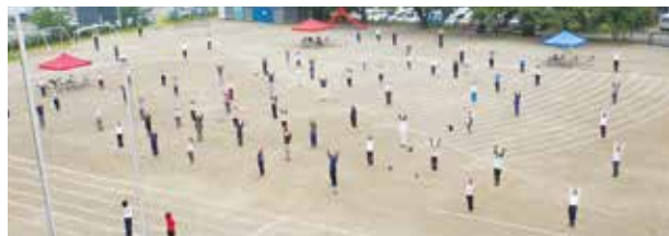
▲ラジオ体操の様子

6月18日、第13回ラジオ体操実践教室が越生小学校グラウンドで開催されました。当日は83名の方が参加し、専門講師から各体操の動きのポイントや効果について学びました。