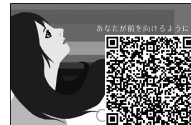
▲性暴力等犯罪被害専用相談 アイリスホットライン