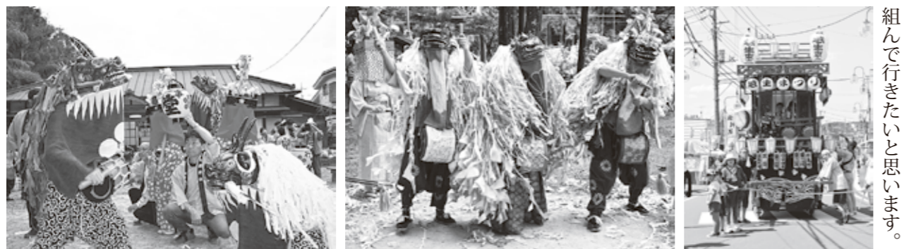
左: 梅園神社の獅子舞(小杉・堂山・上谷下組) 中央: 住吉神社の獅子舞(麦原) 右: 越生東二区獅子連のおはやし組で行きたいと思います。

の獅子舞保存会4団体(町指定無形民俗文化財)、越生東二区獅子連、越生里神楽保存会は、長年使用している太鼓や鉦などの用具や衣装の修理、新調を行います。 来年、盛大なお披露目ができることを願って事業に取り