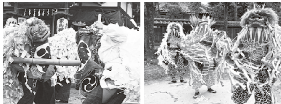
左: 東山神社の獅子舞(上野一区) 右: 八幡神社の獅子舞(津久根)

用具整備事業 上野・津久根・梅園・麦原 に上鉾のせり上がり構造を修理し、往時の高さに復旧しました。今回、幕の復元新調を行うことにより製作時の山車の全容が再現されることとなります。