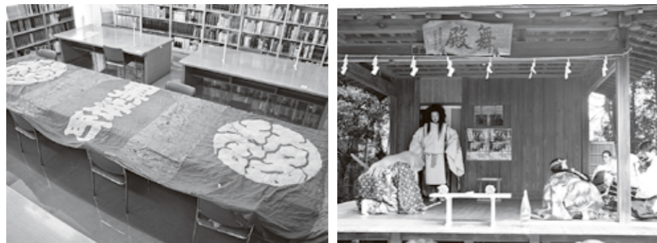
左: 黒岩町山車(町指定有形民族文化財)の上鉾幕 右: 春日神社の里神楽

71,329,000円が交付決定されました。 山車修理事業 河原町・新宿・上町・仲町・本町の山車は、地元で解体後、構造部材の木工事(木材の交換や埋木、補色)を行い、銚金具や彫刻などの装飾類を含めて塗装を行います。 山車飾幕復元新調事業 黒岩の山車は、令和2年度