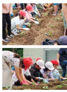
▲サツマイモの植え付けをしました。収穫が楽しみです。

梅園小学校では、「夢や希望を自分の言葉で語る子ども」を目指す子ども像に掲げ、「きれいに、ていねいに、美しく」を児童と教職員との合い言葉に、「知」「徳」「体」のバランスのとれた児童の育成を目指しています。また、子どもたちが安全で安心して、保護者や地域からさらに信頼される開かれた学校をつくるため、全教職員が蓄めて認めて伸ばす「三方よし」の精神で努めています。 「かしこく」＝学力の向上と自立する力の育成 ①一人一人の学力を伸ばす授業を実践します。 ②学び合い・教え合いを指導し、主体的に学習に取り組むように指導します。 ③暗唱やかけ算九九、アルファベットにチャレンジします。 ④自主学習・家庭学習の意欲付けや定着を図ります。 「やこく」＝豊かな心の育成