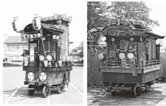
左から、河原町山車、新宿町山車(町指定有形民俗文化財)

越生町は、文化庁の「地域文化財総合活用推進事業(地域の伝統行事等のための伝承事業)」に、民俗芸能を継承・保存する12団体で、山車や山車飾幕、用具の修理・新調を応募しました。 審査の結果、採択された全国215件のうち11番目に高額な