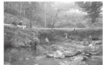
▲龍ヶ谷部会 宮崎初男(令和元年度部会長) 龍ヶ谷川の景観美化事業