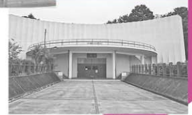
▲世界無名戦士之墓