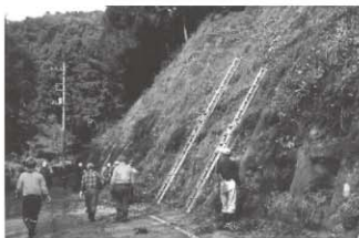
▲麦原部会 戸口昭一(令和元年度部会長) 麦原川整備事業