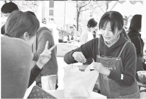
▶ 多くの来場者で盛り上がり ました