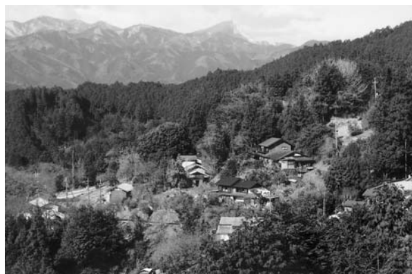
顔振峠見晴台途中から武甲山を望む

明るい疎林になる。大岩の右を巻いて着いた鼻曲山は狭いながら日当たりが良く、木の間に越しに越上山方面が見える。下りはいきなりトラロープが設置された急斜面にな