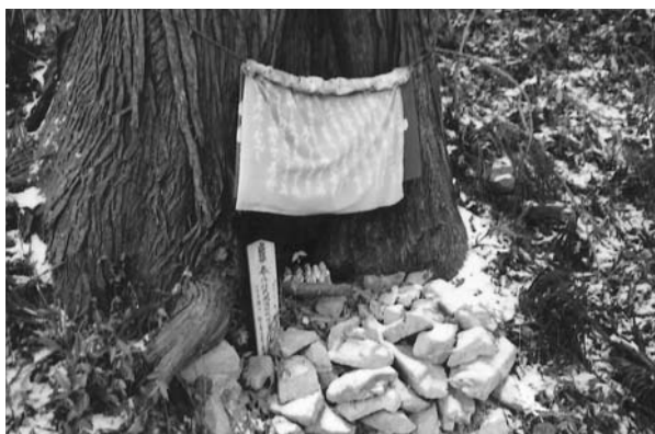
熊野修験お礼と七福神

諏訪神社—30分—一本杉峠—30分—鼻曲山—35分—四等三角点—20分—桂木林道—30分—桂木観音—30分—虚空蔵尊—25分—越生駅