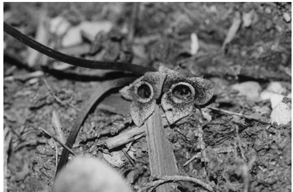
大平尾根のカンアオイ

左から巻き道を合わせ、右にあじさい山への道を分ける。10分で車道に出る。車道手前の左に整地された台地があり、間伐材で作られたベンチが置かれている。