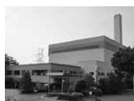
ありがとう 高倉グリーンセンター