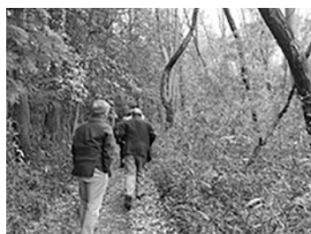
オーパークおごせに近い町有林

越生中学校の旧技術科室に民具がぎっしり。絹織物や農作業、生活の道具類は、町の歴史を物語る貴重な財産です。展示場所など検討課題は多いですが、学習や観光での活用が期待されます。