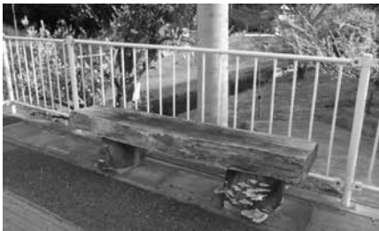
越生梅林 きのこの生えたベンチ

策は。 答 ①5年で256件。個人申請は後で区長申請があるので記録していない。②未処理の案件はない。③記録していない。④処理が放置され、引き継ぎ等も不十分が原因、深く反省。⑤同様の案件はない。⑥受付簿で管理を徹底し、多数者のチェック。