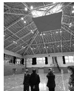
令和3年9月から約半年かけて中央公民館体育館の大規模改修を行いました。落下の危険があった吊り天井の撤去と照明もLEDにしたことにより、広々とした明るい空間となり、今後も住民の健康増進に寄与することが期待されます。トイレと更衣室もきれいになりました。総工費は692万3千円です。