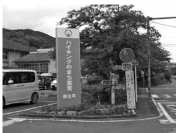
ハイキングのまち宣言看板

答 町史編さん事業による古文書・記録類、寄贈された民具類などの資料は、必ずしも、展示・公開を目的として収集はしていない。資料館の建設予定はないが、里の駅や道灌プラザ等で公開については、研究を進めます。