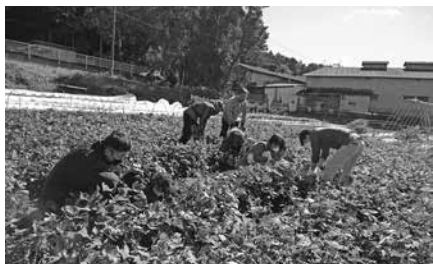
畑は交流の場でもある