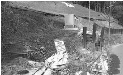
小杉地区ソーラー開発現場・2022年3月8日撮影

答 高齢者の方々が気軽に投票できる環境を整えていく。「投票支援カード」についても検討する。