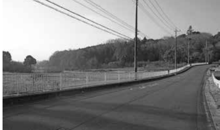
町有林と私有林が混在する里山