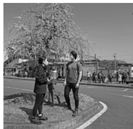
今年は、観梅客が多数来町