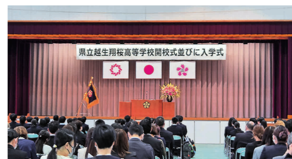
▲県立越生翔桜高校の開校式・入学式の様子