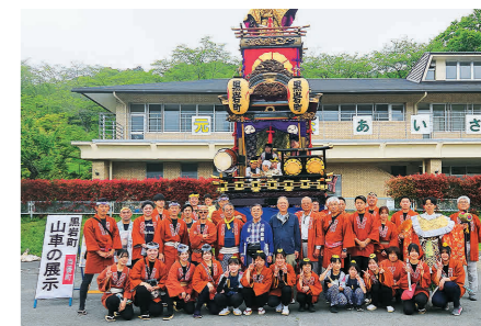
黒岩町の皆さんと山車

多くの皆さまのご協力により、10周年を飾るにふさわしいハイキング大会になりました。厚くお礼申し上げます。