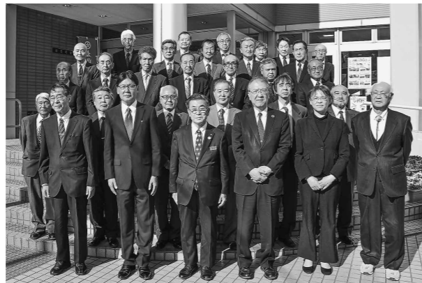
今年度の区長の皆さん