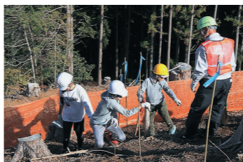
(黒山展望台にて行った植樹体験の様子)

○仲よく助け合う子 「おごせハートプロジェクト」と「体験学習の充実」を図ります。 「おごせハートプロジェクト」では「思いやりの心」「コミュニケーションの心」「静の心」を育成し、どの児童にとっても居心地の良い居場所づくりを目指していきます。 「体験学習の充実」では、町の資源を活用した森林体験学習を充実させるとともに、梅園小との小小連携を強化していきます。 ○元気にやりぬく子 体育の授業、業間休みや昼休みの外遊びの充実を通して、運動好きな児童の育成を図っていきます。 何事にもあきらめない心の育成等、困難を乗り越えられる児童を育てていきます。 本年度もどうぞよろしくお願ひします。