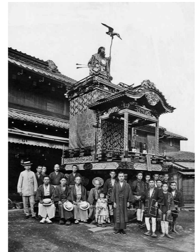
竣功時の本町山車(亀作祭禮道具製作所前)

床下の部材に文政10年(1827)の墨書きがある、越生町では最古の山車です。八王子の山車として建造され、当初は台座に乗った人形が屋根上に立ち上がる型式でした。小曾木(現青梅市)もしくは金子(現入間市)から大正13年(1924)に購入したと伝えられています。令和8年度に屋上の箱棟と龍・波雲の彫刻の修理を実施し、本体の修復工事が完了します。