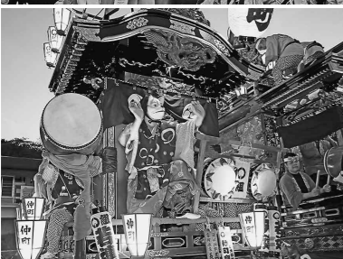
河原町山車(上)・仲町山車(下)