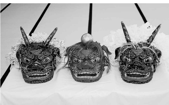
東山神社の獅子舞の獅子頭(現況)