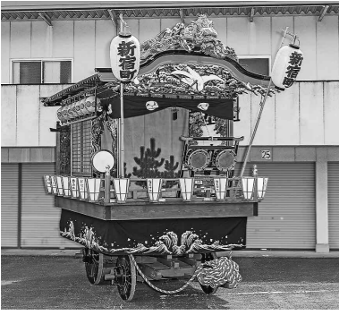
新宿町山車(令和6年4月21日撮影)