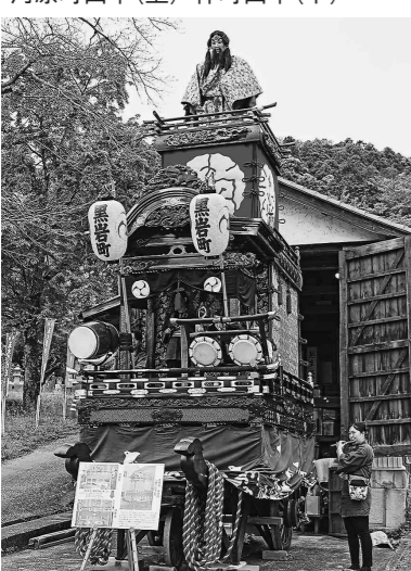
黒岩町山車(令和8年5月3日撮影)