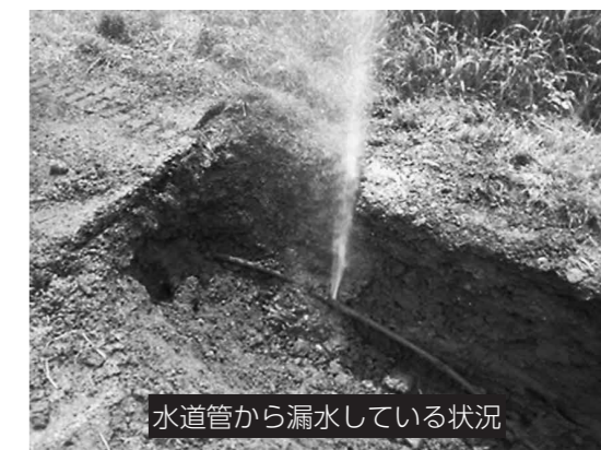
水道管から漏水している状況