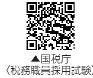
▲国税庁（税務職員採用試験）

○受験資格 令和8年4月1日において高等学校を卒業してから3年を経過していない方ほか ○申込み方法等 原則インターネット申込み 令和8年6月12日（金）午前9時～6月24日（水）（受信有効） ○試験日 第1次試験日 令和8年9月6日（日） ○試験係 関東信越国税局人事第二課試験係 ☎048-600-3111 内線2097