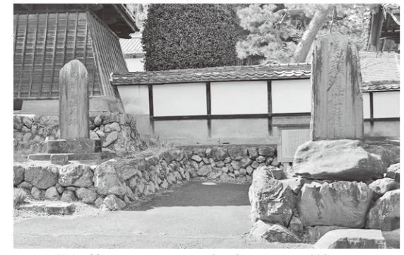
馬頭尊供養塔と馬頭観音世音（法恩寺門前）

越生駅前の法恩寺門前に、2基の馬頭観音の碑が並んでいます。右側の馬頭観音世音は、大正12年（1923）年に、