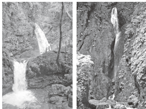
「黒山三滝」(男滝・女滝・天狗滝)

戦後占領期の昭和25年(1950)に毎日新聞が主催したハガキによる投票式の日本百景選定コンテストです。日本の風景を海岸、山岳、湖沼、瀑布、温泉、山谷、河川、平原、建造物、都邑の10部門に分けて募集され、各部門投票数上位10ヶ所が発表されました(応募総数