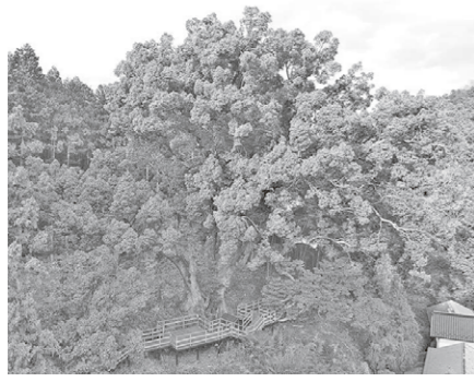
「上谷の大クス」(県指定天然記念物)

この年の旧越生・梅園の人口は1万611人(旧越生町・6千479人、梅園村・3千582人)です。投票活動に携わった地元民の郷土愛や戦後観光復興への強い意志が感じられます。 「21世紀に残したい・埼玉ふるさと自慢100選」平成12年(2000年)に埼玉新聞が主催した県民のハガキ投票による選定事業です(応募総数82万5168通)。県内の名所、自然、史跡、