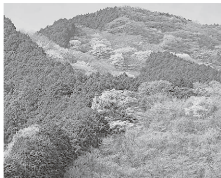
「龍ヶ谷のヤマザクラ」(町指定天然記念物)、「熊野神社の大スギ」

文化財など(ジャンルA)を40選、芸術、スポーツ、芸能、祭りなど(ジャンルB)を40選、物産、食文化(ジャンルC)を10選、県ゆかりの人物(ジャンルD)を10選に分けて募集されました。当町からはジャンルAの第13位に「越生梅林」(7千446票)、第15位「黒山三滝」(7千263票)、ジャンルBの第37位に「越生まつり」(1千365票)がランクインしました。 「名刹巡礼古寺100選」平成24年(2012)にカメラメーカーの写真サイトが選定した百選に、大字龍ヶ谷の曹洞宗寺院・龍穩寺が紹介されました。 「SNS参加型企画 令和二年度県民が選ぶ埼玉の文化