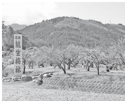
埼玉ふるさと自慢に選ばれた「越生梅林」(県指定名勝)、「越生まつり」