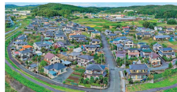
春日地区のパノラマ写真

その土地区画整理事業は、平成7年に仮換地指定され、道路もなく土地の形も以前の不整形な形から、現在の碁盤の目のような形の土地になり、その上に建物も建ちました。そのため、区画整理は既に完了している、との印象をお持ちの方も多かったのではないかと思います。しかし、区画整理は完了しておらず、依然として仮に換地されたままでした。所有者にとって重要な現状を表す不動産（特に土地）の登記簿も図面もできていませんでした。私は就任して間もなく、この仮換地を終了させないと、今後複雑な問題が発生すると思い、換地を完成させるための事業に着手しました。