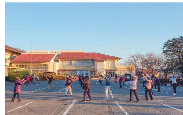
中央公民館でのラジオ体操の様子

越生町では現在9地区でラジオ体操を行っています。私は主に中央公民館で健康増進のため、毎朝6時30分から元気に行っています。まだラジオ体操をされていない方は、良い機会ですので始めてみてください。