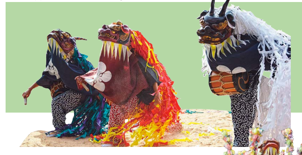
▲中獅子、雌獅子、大獅子

雌雄で袴の色が異なる。長いたてがみが特徴で、大獅子以外は2色を垂らす。水引幕は鋸歯模様と梅鉢紋。