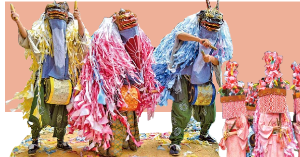
▲中獅子、雌獅子、大獅子

雌雄で衣装が異なる。たてがみは色の濃淡がみられ、毛量が多い。水引幕は青地に菊花紋。