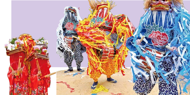
▲大獅子、雌獅子、中獅子

3匹が濃紺、赤と黄、青色に統一された衣装を身につける。たてがみは白を含んだ2色を垂らす（大獅子以外）。顎下の水引幕は鋸歯模様と牡丹の柄。