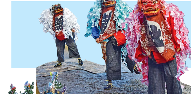
▲大獅子、中獅子、雌獅子

白、青、赤の上衣に袴は同じものを履く。たてがみは刷毛塗りにされている（大獅子以外）。水引幕は波模様に諏訪・社の文字。