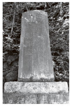
梅園村分会設立記念碑 (昭和6年<1931>建立)

昭和6年(1931)に梅園神社に建立された帝国在郷軍人会梅園村分会設立20周年記念の碑です。帝国在郷軍人会とは、明治43年(1900)に、日露戦争前後から全国各地に組織されていた在郷軍人団体を陸軍省の指導の下に統合して設立された組織で、帰休兵や予備役軍人らが会員となり、軍事教育の発達や軍人精神の養成などを目的に活動しました。