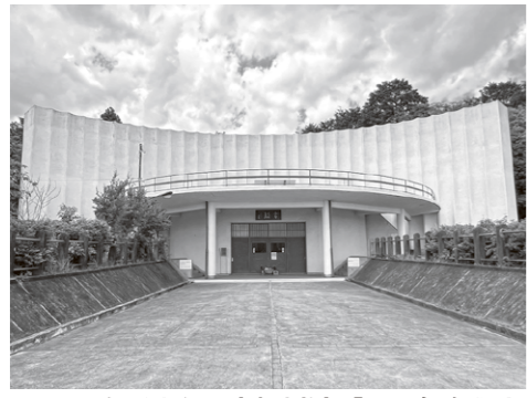
国登録有形文化財(建造物)「世界無名戦士之墓」(昭和29年<1954>竣工)

第二次世界大戦戦没者の納骨・慰霊施設「世界無名戦士之墓」(国登録有形文化財)には、大東亜戦争(太平洋戦争)で亡くなった旧越生町出身の171人を慰霊する碑があり