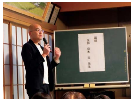
園毛呂山越生在宅医療支援センター ☎295-2320

内容 在宅医療を中心とした医療・介護に関して 対象 越生町在住の方（15名程度から） 費用 無料（施設使用料はご負担いただきます） 場所 越生町の施設・集会所等 時間帯 午前10時～午後4時（原則90分以内）