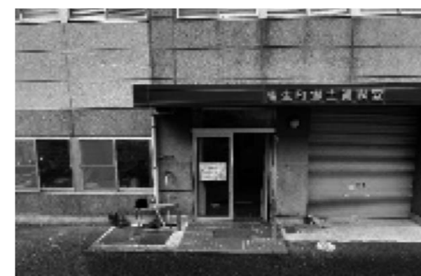
▲【郷土資料室】扉入って左側のお部屋です