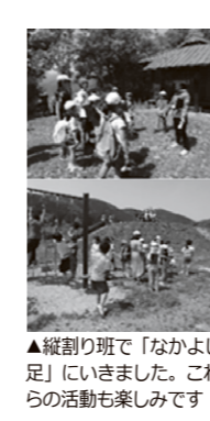
▲縦割り班で「なかよし遠足」にいきました。これからの活動も楽しみです

「安全・安心な学校」 ①いじめ、暴力、不登校、交通事故を「ゼロ」にします。 ②スクールガードリーダーや見守り隊と連携し、登下校の見守りを継続します。 「家庭や地域に開かれた学校」 ①学校運営協議会やPTA本部会議を実施し、保護者や地域との連携を深めます。 ②学校応援団の活用を図ります。 「心からだの育成」 ①体育授業や朝マラソン、チャレンジタイム、外遊びなどで体力(走力)をつけます。 ②規則正しい生活習慣を身につけて健康な体をつくります。 ③何事にも挑戦し、本気で取り組み、最後までやりぬく根気強さ、たくましさを育てます。 ④合唱指導を充実させ、豊かな心を育てます。 「たくましく」＝たくましい心からだの育成 ①「コミュニケーション」を通して、豊かな心を育てます。 ②読書活動や体験活動を通して、豊かな心を育てます。 ③全教育活動の中で道徳的実践力、人権尊重や人権感覚を育てます。