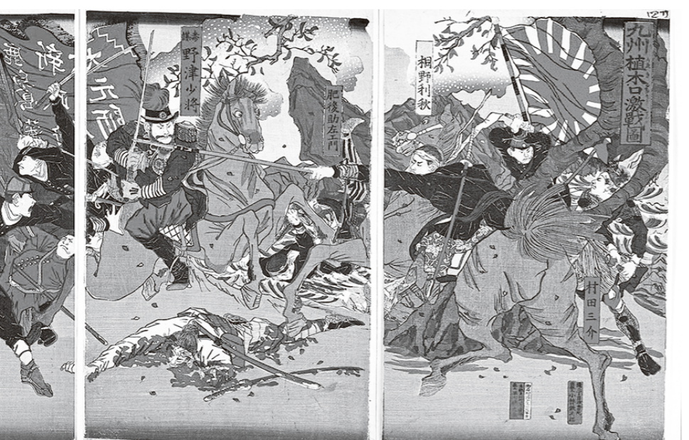
早川松山『九州植木口激戦図』