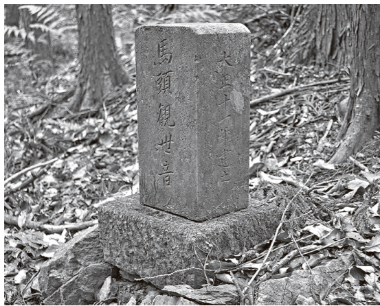
山道の辻に建つ馬頭観音