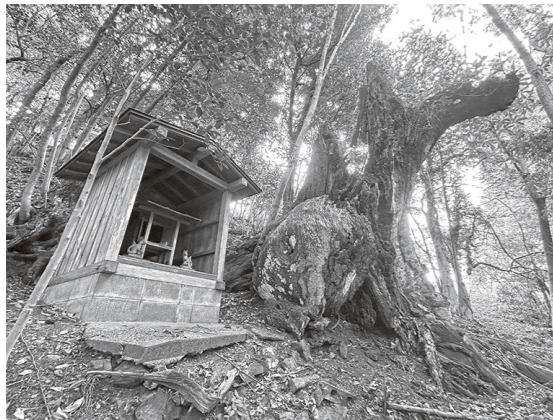
「山入のケヤキ」(2023年4月撮影)