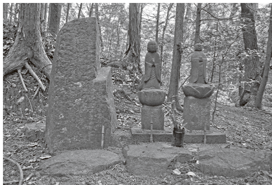
石造物(左から、百観音供養塔、比丘尼像、三界万霊塔)

今回は、町内で撮影したスナップ写真を紹介します。 「山入のケヤキ」 4月、文化財担当の大先輩に連れられて、「山入のケヤキ」を見てきました。昭和39年(1964)に埼玉県指定天然記念物に指定され、同55年に枯死のために指定解除に