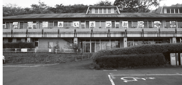
▲看板が設置された公民館の写真

越生中学校の生徒が制作した看板を中央公民館正面玄関上に設置しました。美術の先生の指導を受けながら、生徒自らが言葉を考え、制作したもので、越生町教育委員会が勧めている「あいさつ運動」を後押ししてくれるものです。