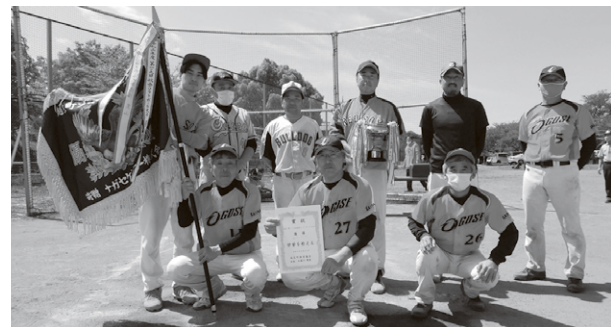
▲優勝したミドルチームのみなさん