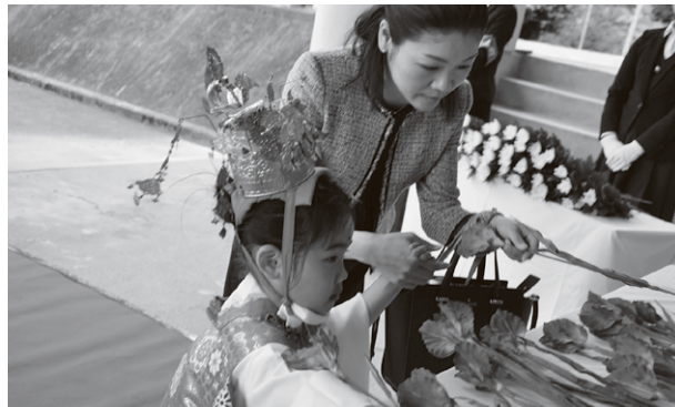
▲慰霊の献花を行うお稚児さん

5月13日(土)、世界無名戦士之墓で「世界無名戦士之墓慰霊大祭並びに越生町戦没者追悼式」が開催されました。稚児と参列者による慰霊の献花や平和の鐘の打鐘が行われました。