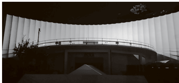
▲ライトアップされた霊廟

5月11日(木)、12日(金)、平和都市宣言をしている越生町は、恒久平和の願いと戦争の犠牲者への哀悼の意を表すとともに、一日もはやく世界が平和になることを願って、世界無名戦士之墓霊廟をウクライナの国旗色にライトアップしました。