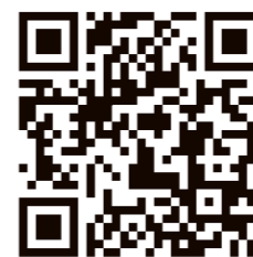
▲協議会ウェブサイト

日程 6月23日(金) 場所 さいたま市 大宮ソニックシティ4F市民ホール 時間 午後1時〜4時(入退場自由 受付時間 正午〜3時30分) 対象者 2024年3月大学・短大・専門学校等卒業予定者および3年以内の既卒者 ※参加企業名は当協議会ウェブサイトで開催2週間前より掲載