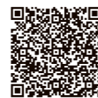
▲植樹祭シンボルマーク募集ホームページ

募集期間 6月23日(金)まで 内容 第75回全国植樹祭の大会テーマ(一人・森・川つなげ未来へ 彩の国)や開催理念・大会の基本方針を踏まえて、所定デザインの埼玉県マスコット「コバトン」と「さいたまつち」の背景や周りをデザインして全体をシンボルマークとしたもの ※開催理念や募集要領等の詳細は、第75回全国植樹祭ホームページをご覧ください。