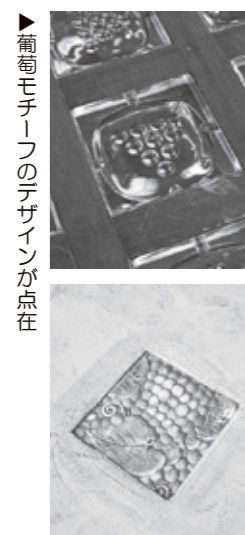
▶葡萄モチーフのデザインが点在