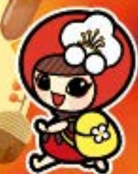
越生町のマスコット 「うめりん」

年間全12回 (令和2年4月~令和3年3月)の うち7回以上参加された方に 記念品を贈呈