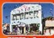
観光案内所オーテック