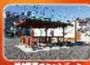
越生駅前ポケットパーク