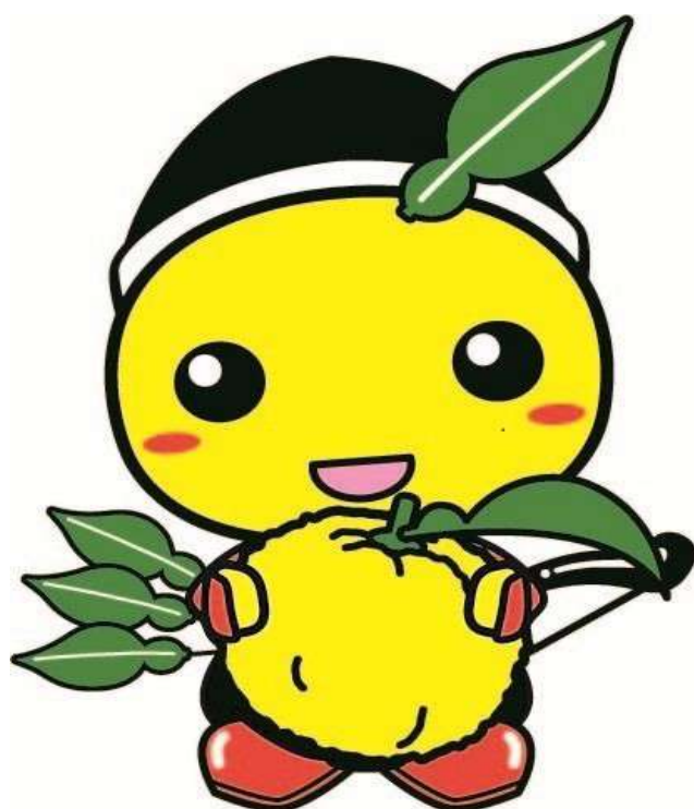
もろ丸くん(毛呂山町)