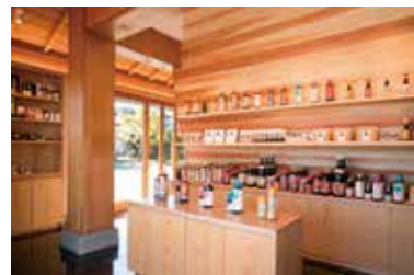
醤油レーズンサンドなどが並ぶショップ