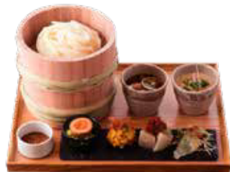
しょうゆ蔵のレストラン